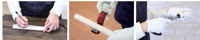
イレクター専用ハンドカッター「EK-9」